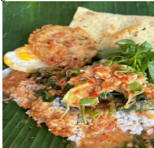
Gambar 2. Pecel Pincuk Garahan

Kegiatan sosialisasi berbasis komunitas lokal dilaksanakan pada hari Sabtu, 17 Mei 2025, bertempat di Balai Desa Garahan, Kecamatan Silo, Kabupaten Jember. Pemilihan lokasi ini bukan tanpa alasan. Balai desa dipilih sebagai ruang pertemuan karena merupakan tempat yang paling familiar dan mudah dijangkau oleh seluruh lapisan masyarakat, mulai dari para pelaku usaha Pecel Pincuk, ibu rumah tangga, tokoh masyarakat, hingga generasi muda desa. Kegiatan dimulai pukul 09.00 WIB dan berlangsung hingga sore hari, dengan suasana yang hangat, terbuka, dan penuh antusias dari seluruh peserta yang hadir.