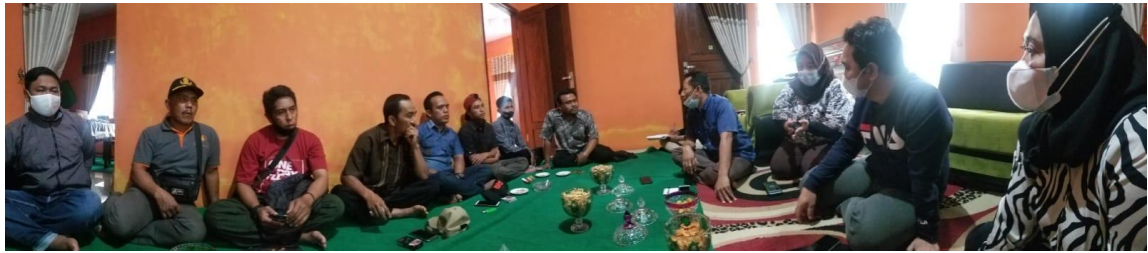
Gambar 3. Pelatihan Konsep Gastronomi dan Identitas Lokal

Peserta pelatihan terdiri dari sekitar empat puluh orang yang mewakili berbagai kelompok komunitas, mulai dari ibu-ibu pelaku usaha kuliner, remaja putri anggota karang taruna, kader PKK desa, hingga beberapa bapak-bapak yang dengan antusias turut bergabung. Kehadiran lintas generasi dan lintas gender dalam satu ruang pelatihan ini menjadi pemandangan yang menggembirakan, menunjukkan bahwa semangat untuk merawat warisan kuliner lokal tidak hanya milik satu kelompok, melainkan menjadi tanggung jawab bersama seluruh elemen komunitas.