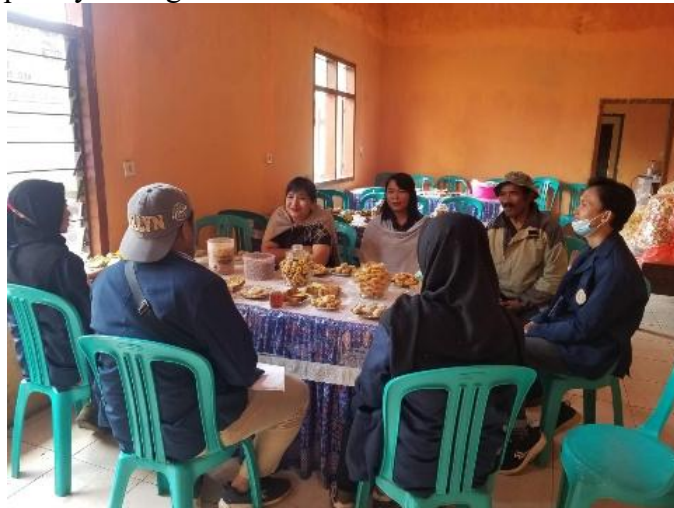
Gambar 4. Evaluasi kegiatan dengan perwakilan komunitas pecel garahan

Proses evaluasi kegiatan pelatihan gastronomi kuliner dilaksanakan pada hari Senin, 19 Mei 2025, bertempat di ruang pertemuan Balai Desa Garahan, Kecamatan Silo, Kabupaten Jember. Kegiatan evaluasi ini dirancang sebagai tahap penutup yang tidak kalah penting dari rangkaian kegiatan pengabdian masyarakat yang telah berlangsung selama dua hari sebelumnya. Jika sosialisasi merupakan proses membangun kesadaran dan pelatihan merupakan proses membangun keterampilan, maka evaluasi adalah proses membangun refleksi bersama untuk mengukur sejauh mana kedua proses tersebut telah memberikan dampak nyata bagi komunitas lokal Pecel Pincuk Garahan.