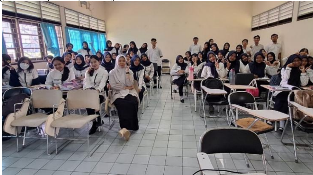
Gambar 2. Perencanaan kegiatan

Pada tahap ini, mahasiswa dibagi ke dalam beberapa kelompok dan menyusun rencana kegiatan edukasi dan sosial secara mandiri dengan pendampingan dosen. Hasil yang dicapai pada tahap ini adalah tersusunnya proposal kegiatan kelompok yang memuat jenis kegiatan, sasaran, tujuan, jadwal pelaksanaan, serta pembagian tugas masing-masing anggota. Mahasiswa mampu mengkomunikasikan ide dan gagasan kegiatan melalui diskusi kelompok, yang menunjukkan mulai berkembangnya kemampuan komunikasi interpersonal dan kerja sama tim. Dengan demikian, tahap perencanaan dalam program ini berfungsi sebagai ruang Latihan komunikasi, negosiasi, pengambilan keputusan, dan kerja sama tim.