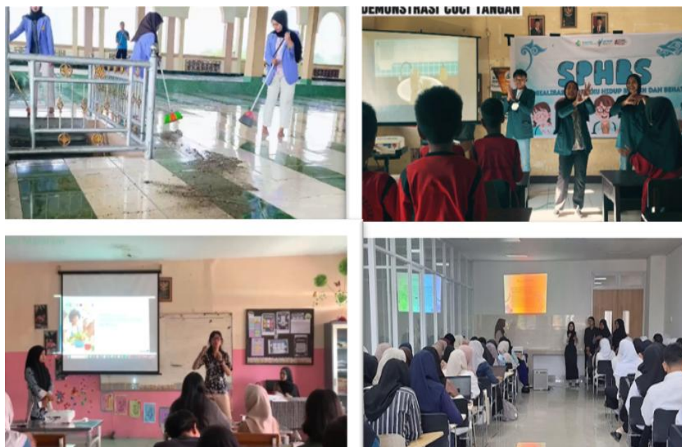
Gambar 3. Pelaksanaan kegiatan mahasiswa