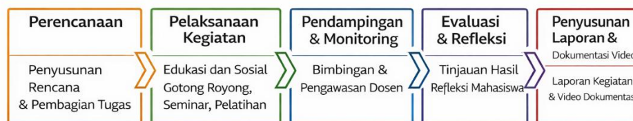
Gambar 1. Tahapan Kegiatan

Metode pelaksanaan pada program pengabdian kepada masyarakat ini menggunakan pendekatan pelatihan dan pendampingan. Pendekatan ini dipilih karena menyoroti keterlibatan langsung mahasiswa dalam setiap Langkah kegiatan, mulai dari proses perencanaan hingga tahap evaluasi, yang pada gilirannya dapat meningkatkan kemampuan komunikasi, interaksi sosial, kerja sama tim, serta rasa tanggung jawab sosial mahasiswa.