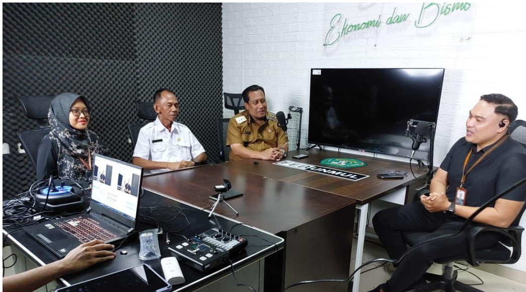
Gambar 1. Kegiatan Podcast Literasi Statistik

Tahap persiapan kegiatan podcast diawali dengan proses koordinasi dan pemetaan kebutuhan bersama mitra, yang melibatkan Badan Pusat Statistik (BPS), Pemerintah Kelurahan Bukit Pinang, serta tim akademisi. Pada tahap ini dilakukan diskusi awal untuk mengidentifikasi isu literasi statistik yang paling relevan dengan konteks kelurahan, khususnya terkait pemahaman indikator statistik dasar dan implementasi Program Cinta Statistik. Hasil pemetaan menunjukkan bahwa terdapat kebutuhan penguatan pemahaman mengenai memberikan pemahaman masyarakat terhadap data dan implikasinya terhadap kebijakan pemerintah khususnya kebijakan pemerintah kelurahan, sehingga materi podcast dirancang untuk menjawab kebutuhan tersebut secara kontekstual dan aplikatif.